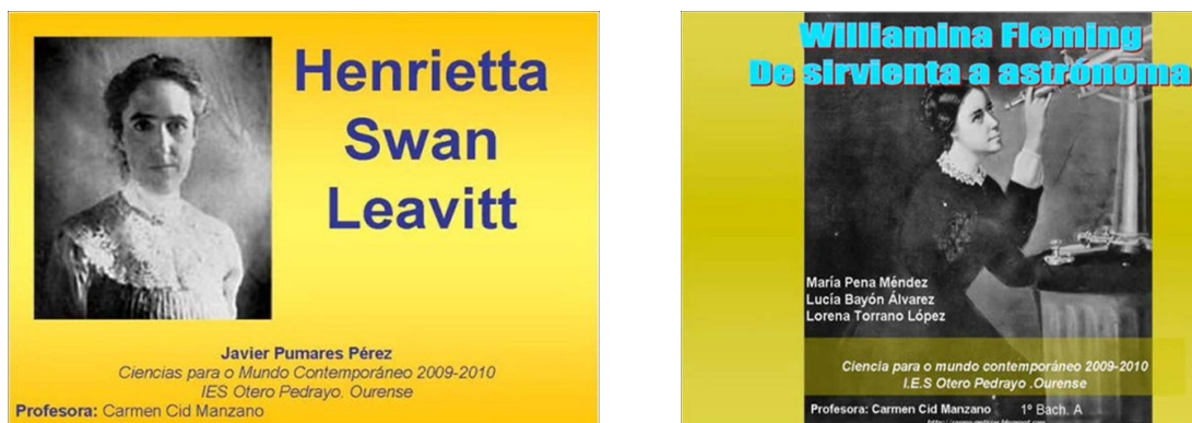
Figura 3. H. Swan Leavitt y W.Fleming.