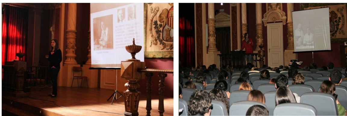
Figura 9. Presentación Rosalind Franklin y de Lise Meitner.