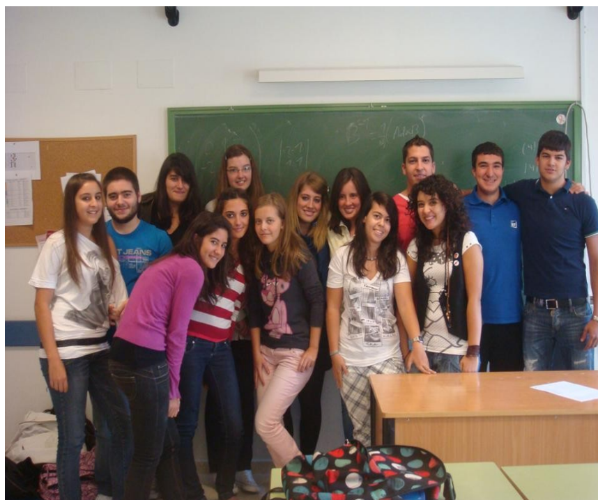
Figura 1. Alumnado de 1º de Bachillerato que realizó el trabajo.