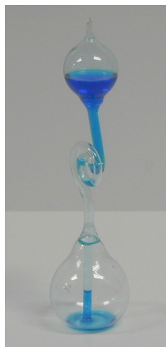
Figura 3. Hervidor de mano ( hand boiler , en inglés). Con el líquido en su bulbo inferior, si éste se cubre con la mano, el líquido se evapora, aumenta su presión, y asciende por el tubo que conecta ambos bulbos, manteniéndose en el bulbo superior mientras la mano rodea el bulbo inferior.

La parte puntiaguda del bulbo superior del hervidor de mano, que en el pájaro bebedor se encuentra escondida justo debajo del sombrero, indica que se trata de un tubo anterior que ha sido utilizado para hacer el vacío -es decir, una bomba de vacío ha extraído todo el aire del interior del pájaro, dejando sólo vapor del líquido volátil- y que luego se ha cerrado a la llama, para evitar que vuelva a entrar aire. Es fundamental que no haya nada de aire dentro del hervidor, ni del pájaro, pues en caso contrario el líquido que asciende deberá comprimir dicho aire y no logrará subir.