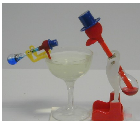
Figura 1. Dos modelos del pájaro bebedor. Cuando la cabeza se moja, el pájaro irá inclinándose hasta perder el equilibrio, llevar su pico hasta el agua, volver a elevarse, oscilar durante algunos instantes, y repetir el ciclo.

Para hacerlo funcionar, se coloca el pájaro bebedor, inicialmente en posición vertical, al lado de un vaso con agua, de tal forma que en posición horizontal el pájaro tenga un tope pero su pico se introduzca en el agua. Se moja el fieltro de su cabeza con agua y se espera. Al cabo de