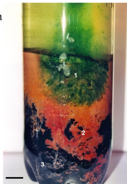
Figura 2.- Columna de Winogradsky preparada en un cilindro de plástico transparente. Denótese la diferencia poblacional en base a la variedad de colores que aparecen en el lecho de arena y columna de agua. (1) Algas fotosintéticas. (2) Bacterias rojas del azufre ( Chromatium spp.). (3) Depósito de sulfuro de metales pesados asociado a la presencia de microorganismos reductores de sulfato. Barra= 1.5 cm.

Los sulfuros producidos por esta compleja comunidad microbiana, bajo condiciones anóxicas, son fuente de electrones para las bacterias fotosintéticas rojas y verdes del azufre alojadas en un estrato superior, caso de los géneros microbianos: Chromatium , Thiocapsa o Thiospirillum . Las bacterias rojas del azufre, mayoritarias en este tipo de modelo experimental, comprenden un grupo de microorganismos anaeróbicos, parcialmente sensibles a la presencia de oxígeno molecular y sulfuro de hidrógeno. Producen compuestos orgánicos reducidos a partir del dióxido de carbono. Dentro de este grupo se halla la familia Cromatiáceas, caracterizada por el género Chromatium .