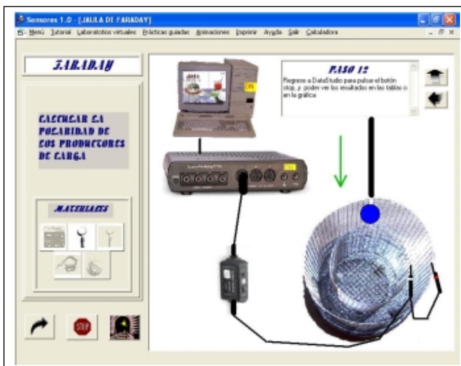
Figura 2.- Modelo simulado de práctica guiada con el programa Sensores1.0 .

La utilización de equipos informáticos de adquisición de datos en los laboratorios de ciencias experimentales de enseñanza secundaria, aunque es una actividad muy interesante, no deja de ser problemática debido a varios hechos entre los que hay que destacar el coste de los citados equipos y las dificultades cognitivas para utilizar estos sofisticados sistemas, que incluyen el manejo de sensores como instrumentos de medida y diversos programas de ordenador que controlan la adquisición y el análisis de datos. Para tratar de superar el segundo de los problemas citados hemos desarrollado recientemente un programa multimedia denominado Sensores 1.0 , destinado a enseñar a nuestros alumnos de los primeros cursos de universidad a manejar uno de estos sistemas de adquisición de datos en el laboratorio de Física (Pontes et al., 2003). Dicho programa tiene varios módulos tales como tutorial, animaciones, laboratorio virtual y prácticas guiadas. En la figura 2 se muestra un ejemplo de práctica guiada sobre la Jaula de Faraday, en el que se simulan los pasos que debe realizar el alumno para montar por sí mismo dicha práctica utilizando el sistema de adquisición de datos disponible en nuestro laboratorio.