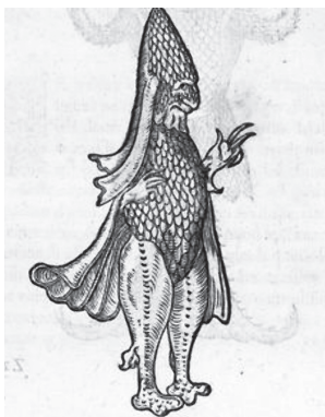
Guillaume Rondelet, El pez obispo.