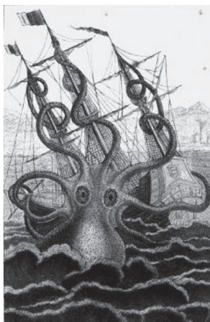
Pierre Denys de Montfort, El kraken.

Pero ya los monstruos marinos han quedado reducidos al reino de la literatura y lo fantástico. En una enciclopedia para niños publicada en España en la década de 1920, Tesoro de la juventud , se muestra, no sin un cierto desprecio, cómo “ hasta los niños pequeños se burlan y ríen al presente de estas historias ridículas que aterrorizaron un día las mentes de los hombres cultos y de los filósofos de la antigüedad... lo que mueve a risa y asombro es que escribiesen libros serios en los que se relataban terribles aventuras habidas con estos seres imaginarios ” 119 ...y, para ilustrar, se incluyen imágenes extraídas de los venerables grabados de Gessner y Aldrovandi. El mito, finalmente, ha acabado convirtiéndose en un mero relato infantil, aunque seguirá conservando una vertiente relacionada con el Otro absolutamente devastador, siendo ejemplo de ello el Moby Dick (1851) del novelista norteamericano Herman Melville (1819-1891)...o el celeberrimo Tiburón (1975) de Steven Spielberg.