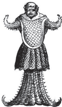
Conrad Gessner, El pez monje.

Producto de las regiones mediterráneas será el peje Nicolao. La versión italiana de la leyenda precede a la española, y se sitúa en la segunda mitad del siglo XV. Ya Alessandro Alessandri (1461-1523), en sus Dies geniales (1532) nos narra el “ Miraculum de homine qui plus in mari quam in terris degebat, maximaque aequora velocissime tranabat ”, y una leyenda similar es recogida por Benedetto Varchi (1503-1565), aludiendo a “un siciliano humilde que no sólo nadaba entre 60 y 80 millas en el mar cuando estaba embravecido...sino que vivía más bajo el agua que en tierra, no creía que podría vivir y respirar sin cada día no iba al agua a perseguir peces del mar...llegando a estar dos o tres días bajo las olas antes de volver a tierra” 112 . Pero Mexía también transmite un relato parecido: “Desde que me sé acordar, siempre hoy contar a viejas no sé qué de cuentos y consejas de un pece Nicolao, que era hombre y andaba en la mar, y de él decían otras cosas muchas en este propósito...de lo que escriben dos hombres de mucha doctrina y verdad: el uno es Joviano Pontano (Giovanni Pontano, 1429-1503) varón doctísimo en letras de humanidad y singular poeta y orador, según sus libros lo testifican; y el otro, Alessandro